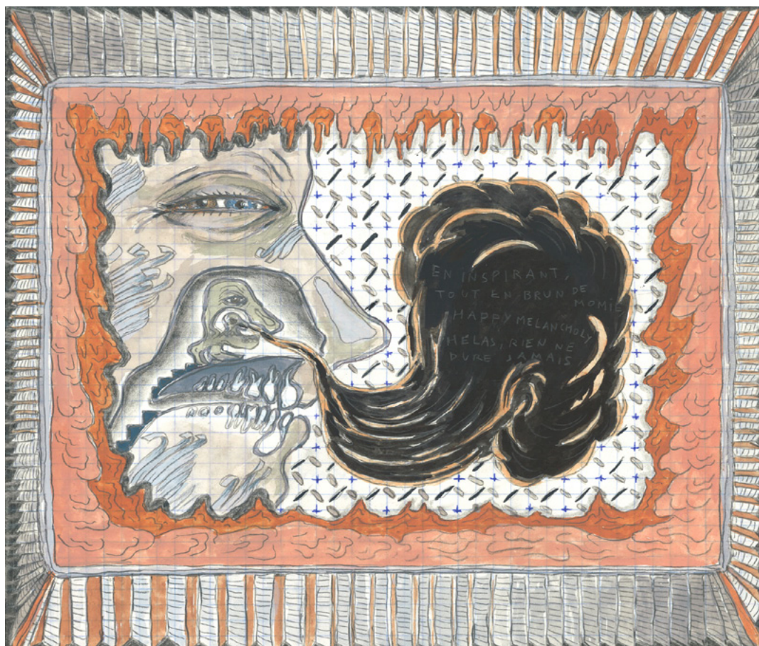
Alexandre Leger, Happy melancholy (détail) , 2019, cahier de 48 pages, crayon et aquarelle sur papier, 32 x 24 cm.

Chaque dessin, réalisé sur un papier ancien, laisse apparaître des lignes d'écriture à la plume, des bribes de correspondances, des mots imprimés, issus de vieux cahiers d'écolier, de manuels administratifs, d'archives personnelles ou de solutions de mots-fléchés. Alexandre Leger affectionne les jeux du langage, associant des récits personnels au hasard des mots collectés. Les textes, entre fragments poétiques, étranges slogans ou paroles de chansons détournées, éclairent les scènes dessinées ou viennent les contredire.