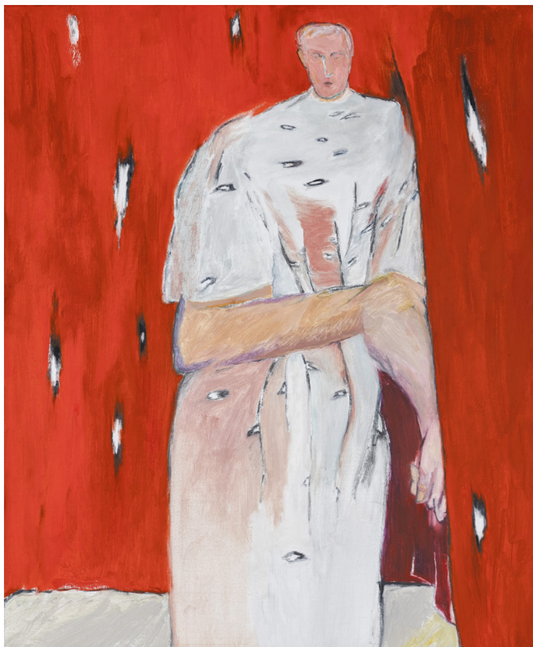
Firenze Lai, Red curtain , 2018, huile sur toile, 85 x 70 cm.

Assis bien serrés dans un bus, debout à faire la queue dans le métro, courbés dans des passages souterrains, les personnages occupent la majeure surface du tableau parfois trop petit pour contenir leur corps ou leurs pensées. Firenze Lai les représente de manière disproportionnés, insistant sur les jambes et les pieds, à peine dégrossis, plus à même de s'ancrer dans un espace contraint. Visages et regards, toujours plus petits, indiquent un champ de vision trop réduit pour se repérer dans un monde immense, incontrôlable.