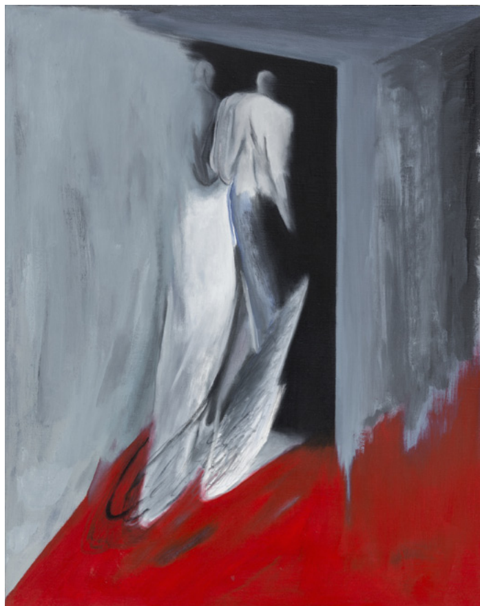
Firenze Lai, Politics , 2016, huile sur toile, 75 x 60 cm, collection privée. © Firenze Lai

Biographie : Firenze Lai (1984, Hong Kong) est diplômée de la Hong Kong Art School. Son travail a été notamment présenté à la 10 e Biennale de Shanghai et à la New Museum Triennial à New York en 2015 ; à LASALLE College of the Arts, Singapour en 2016 ; à la 57 e Biennale de Venise en 2017 et à la Fosun Foundation de Shanghai en 2018. Firenze Lai vit et travaille à Hong Kong.